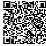
広島県ため池マップ