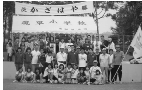
風早選手団・東広島運動公園にて

6月4日(日)東広島市運動公園陸上競技場で、市内37チームによって陸上の部の競技が行われ、風早小学校区チームは9位の好成績でした。今年度は第18回の大会で、安芸津町では合併後初めて全ての小学校区チームが参加しました。