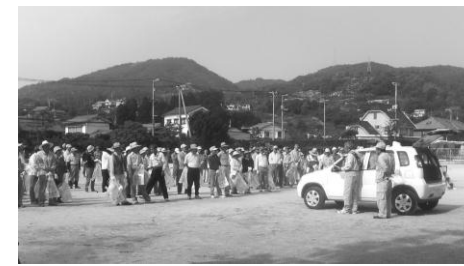
風早小での開会式

東広島市では、毎月第2日曜日を『環境美化の日』と定め全市一斉清掃を推進しています。