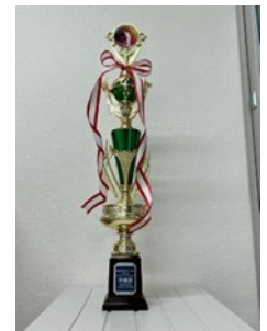
グランドゴルフ準優勝のトロフィーと賞状