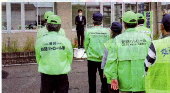
【福山西】全国地域安全運動開始式を行い結束を強化（10月9日）

福山市西部市民センターにおいて、警察、市役所、各地区防犯ボランティア関係者等約50名が集まり、全国地域安全運動開始式を行いました。式では、地元高校の吹奏楽部員と警察官によるコラボ演奏を行い、防犯活動の士気の高揚に繋がりました。