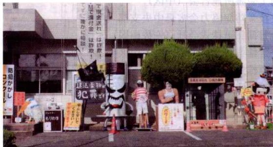
【庄原】「防犯かかし」とれが一番？（10月11日）

福山市西部市民センターにおいて、警察、市役所、各地区防犯ボランティア関係者等約50名が集まり、全国地域安全運動開始式を行いました。式では、地元高校の吹奏楽部員と警察官によるコラボ演奏を行い、防犯活動の士気の高揚に繋がりました。