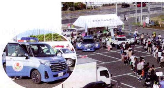
【東広島】消防・防災フェアで新型モシカ号をお披露目（11月3日）

大桝中学校体育館に市内の中学生を集め、代表者7名による意見発表大会を行いました。学校や家庭、地域社会の中で日頃の考えや感じていることなど、自由なテーマで発表を行い、「価値観の違い」を題材にした能美中学校の生徒が最優秀賞に選ばれました。