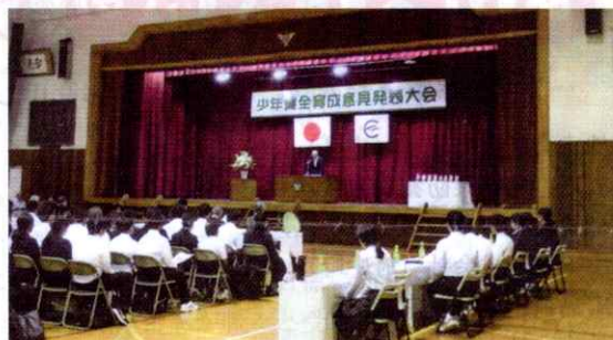
【江田島】令和5年度江田島市少年健全育成意見発表大会の開催（10月24日）

大桝中学校体育館に市内の中学生を集め、代表者7名による意見発表大会を行いました。学校や家庭、地域社会の中で日頃の考えや感じていることなど、自由なテーマで発表を行い、「価値観の違い」を題材にした能美中学校の生徒が最優秀賞に選ばれました。