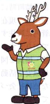
「減らそう犯罪」 県民総ぐるみ運動 マスコットキャラクター 「モシカ」

東広島市消防局駐車場広場で行われた消防・防災フェアに、安全安心ブースを設けて、このたび更新した青パト「モシカ号」を展示しました。数百人の子供たちが乗車し、ふれあいを深めました。