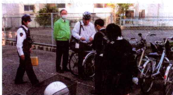
【尾道】自転車盗難防止啓発活動の実施（10月18日）

庄原警察署の正面にユニークな防犯かかしが勢ぞろいしました。どの作品も今年活躍したタレントやキャラクターなどを使って、特殊詐欺被害防止や薬物乱用防止を呼びかけるもので、闇バイトを題材にした作品が最優秀賞に輝きました。