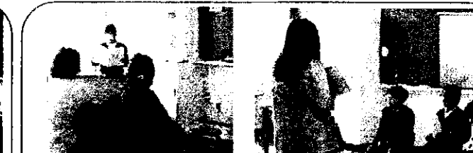
4年・さざなみ 総合的な学習「1/2成人式」