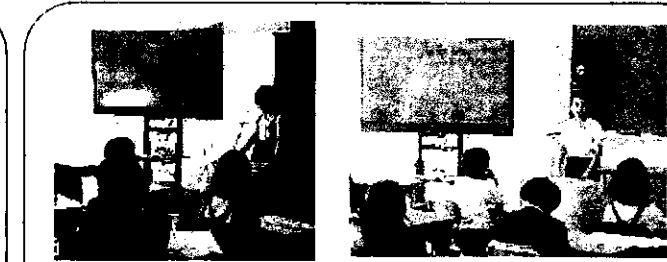
2年・さざなみ 生活科「こんなに大きくなったよ」