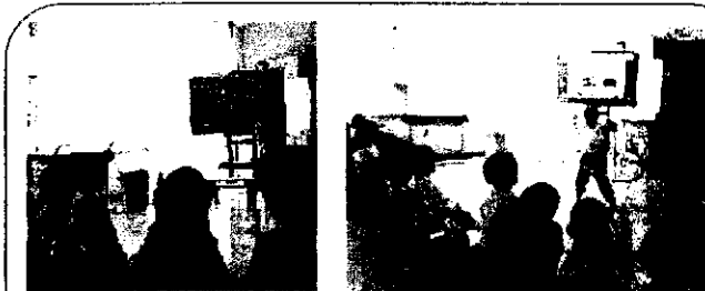
1年 生活科「もうすぐ2年生」