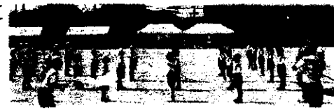
全校児童「応援合戦」