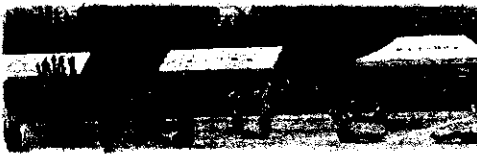
5・6年生「風早の希望」