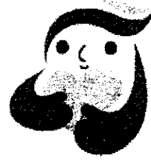
犯罪被害者等支援 シンボルマーク 「ギョつとちゃん」