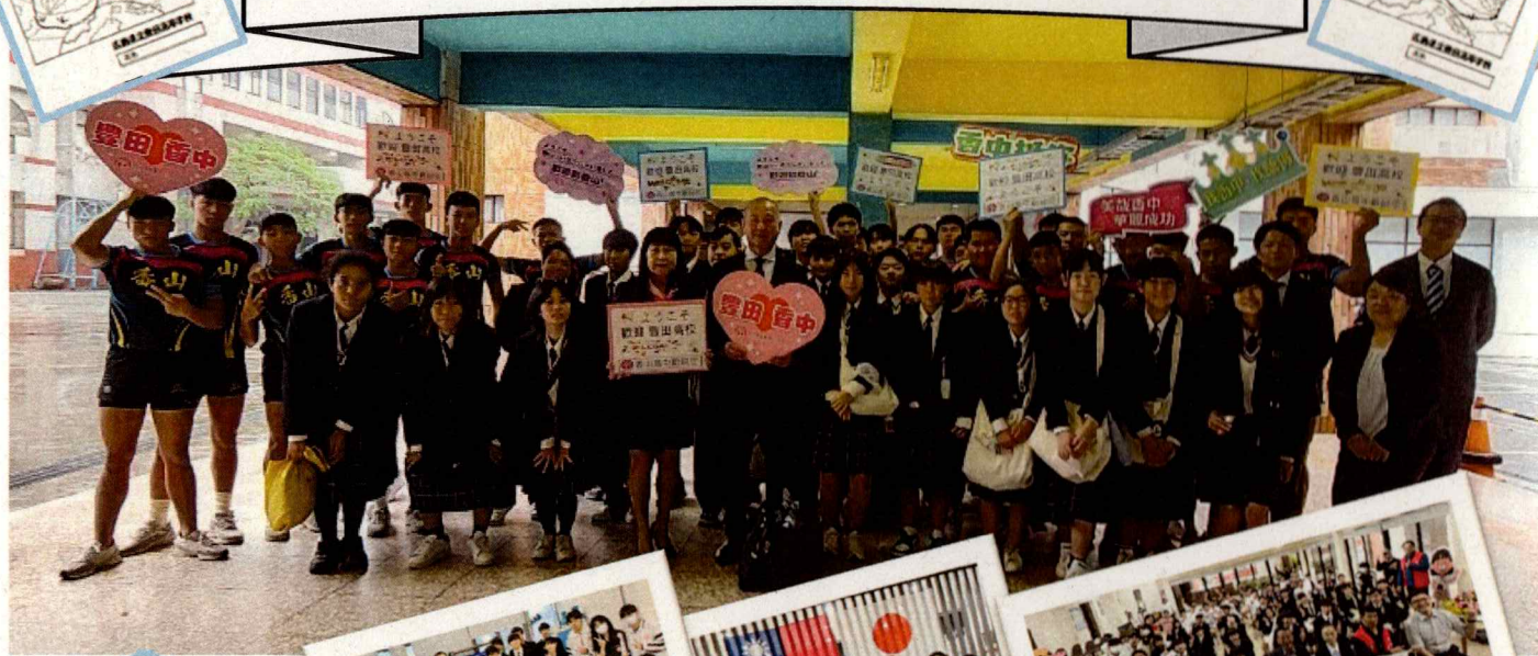
新竹市立香山高級中學のHPでも紹介されました!