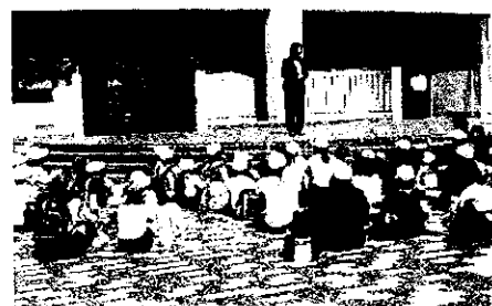
豊田高校の校長先生にお話していただきました。