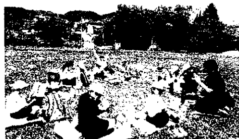
わくわく班で、仲良くお弁当を食べました。