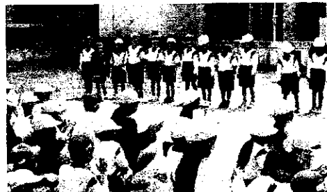
1年生の自己紹介、上手にできました!