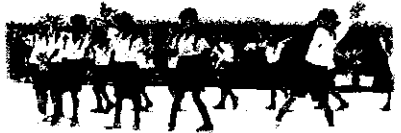
1・2年生「かざはやダンスホール」