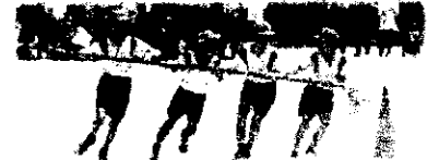
3・4年生「巻き起こせ!風早旋風」