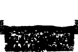
カルストロードの展望台から見た、雄大な自然に感動!