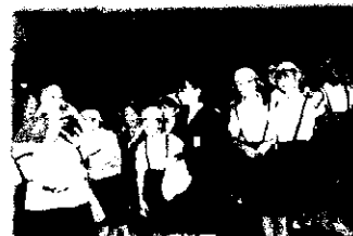
日本屈指の大鍾乳洞「秋芳洞」。自然の力の大きさに驚きました

6年生が、山口方面に1泊2日の修学旅行に行ってきました。この修学旅行に向けて、クラスで目標を決めたりそれぞれの係や役割の準備を工夫して行ったりと、最高の思い出を作るために頑張ってきた子供達。2日間の団体生活の中で、友達との絆を深め、楽しい思い出を作ることができました。