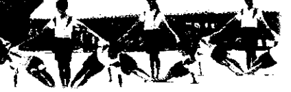
5・6年生「風早の希望」