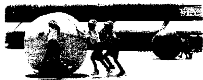
1・2年生「ころがせ!ころがせ!大玉!」

晴天に恵まれ、盛大に開催することができた運動会。「笑顔で 楽しく 最後まで 全力で 頑張ろう (がんばろう)」のテーマのもと、子供達は練習の成果を出し切り、最後まで全力で演技することができました。ご来賓の皆様、地域の皆様、保護者の皆様からの温かいご声援や拍手が子供達の力になり、自信につながりました。この経験を今後の生活に活かしてほしいと思います。また、準備から片付けまで多くの皆様にご協力頂きました。本当にありがとうございました。