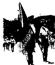
優勝旗・準優勝杯授与