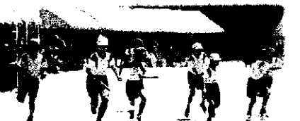
5・6年生「リレー ~バトンをつなげ~」