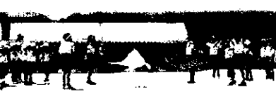
全校児童「応援合戦」