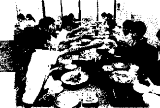
萩観光ホテルでの夕食の様子。美味しくお代わりをする児童がたくさんいました。