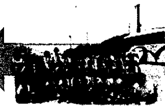
海峡ビューしものせきで昼食。関門海峡を一望できる絶景も楽しみました。