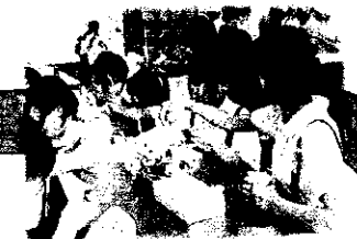
萩焼の絵付け体験に取り組み真剣な表情。出来上がりが楽しみ!