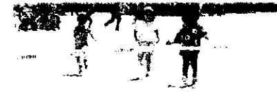
未就学児「かけっこ」