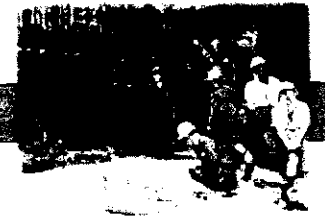
秋吉台サファリランドでは、様々な動物と触れ合いました。