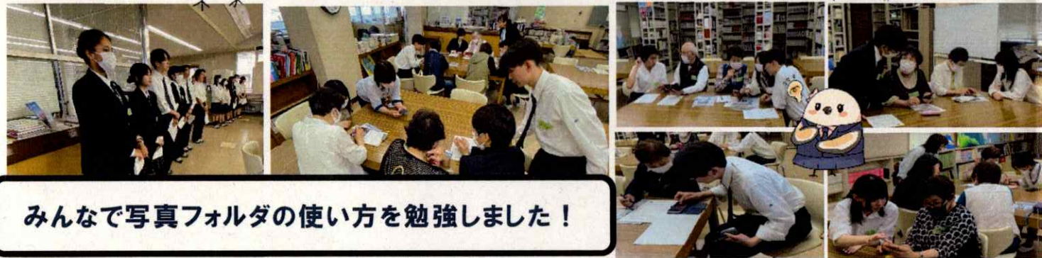
みんなで写真フォルダの使い方を勉強しました！

令和6年5月30日(木)、社会福祉協議会と共催で、安芸津町内の方を対象に「スマホ教室」を本校図書室で開催しました。10名の地域の方々に11名の生徒がスマートフォンの操作等をお教えしました。全員の自己紹介で和やかな雰囲気から始まり、ペアでの交流で、積極的に地域の方から「〇〇教えて！」「〇〇どうやるん？」と、会話がはずみ、あっという間に1時間が過ぎました。次回の開催を乞うご期待！