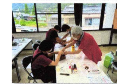
バラエティーハンドメイド