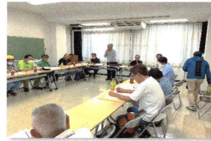
ペットボトル訪問