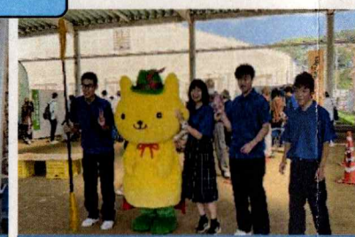
9/8 チャレンジフェスタ