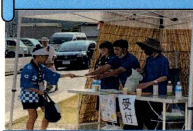
8/24 ふれあい夏まつり