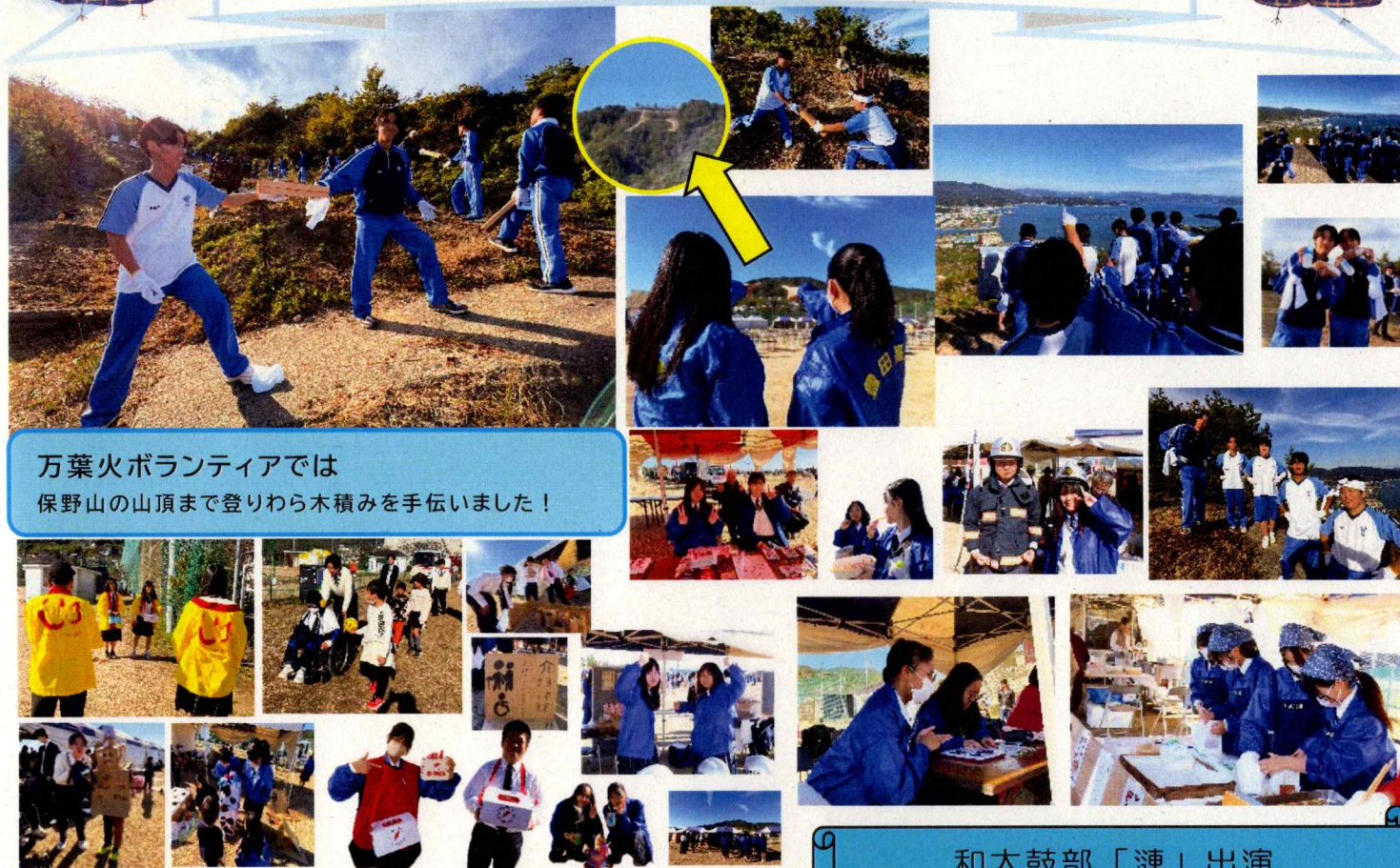
万葉火ボランティアでは 保野山の山頂まで登りわら木積みを手伝いました！