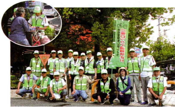
【広島東】被害防止キャンペーンの開催(7月19日)

広島東防犯連合会では、管内の大型スーパーにおいて、自転車盗被害防止キャンペーンを開催しました。行き交う買い物客に対してワイヤー錠やチャシを配って「二重ロックで盗難防止」を呼びかけ、防犯意識の向上を図りました。