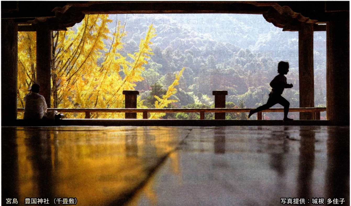
宮島 豊国神社 (千畳敷)

「防犯ひろしま」は広島県防犯連合会のホームページ ( http://www.enjoy.ne.jp/~bouhan ) でも閲覧(印刷)ができます。