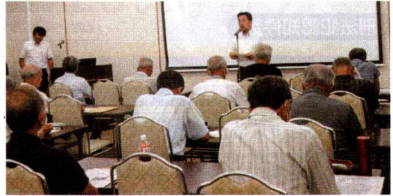
【広島中央】安心安全アカデミーへの積極参加(8月24日)

広島中央防犯連合会は、中区民文化センターで開催された「安心安全アカデミー」を8人の会員が受講しました。ボランティア活動に必要な知識や心構えを学び、今後はボランティアリーダーとして地域の安全安心を築いていきたいと、誓い合っていました。